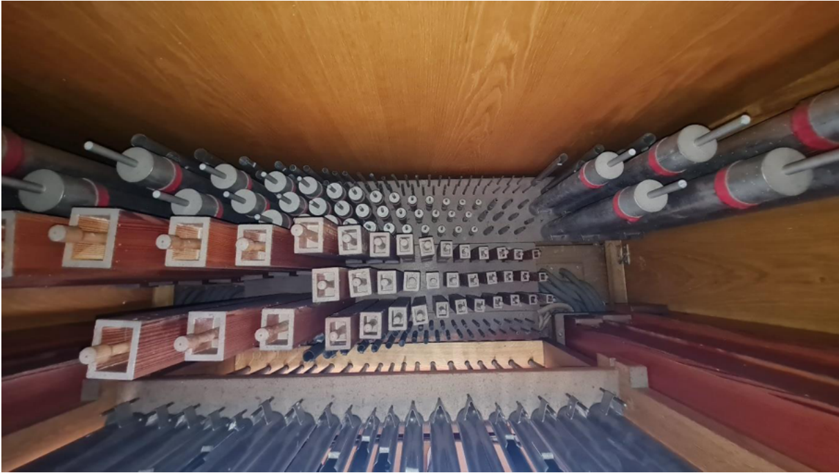
Abbildung 4: Pfeifen des Manualwerkes