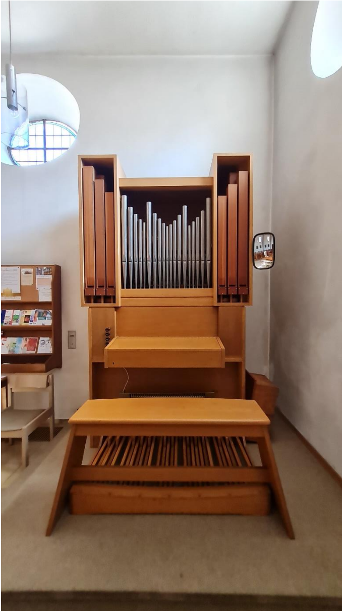
Abbildung 1: Prospekt