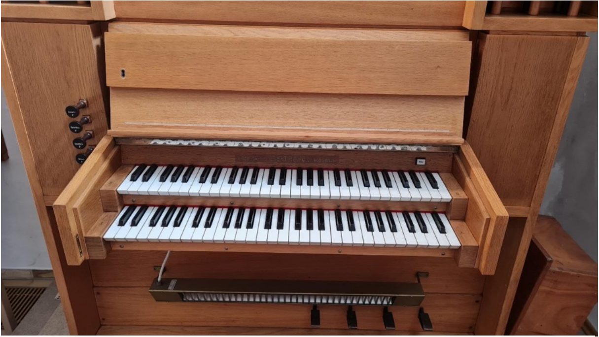
Abbildung 3: Spieltisch